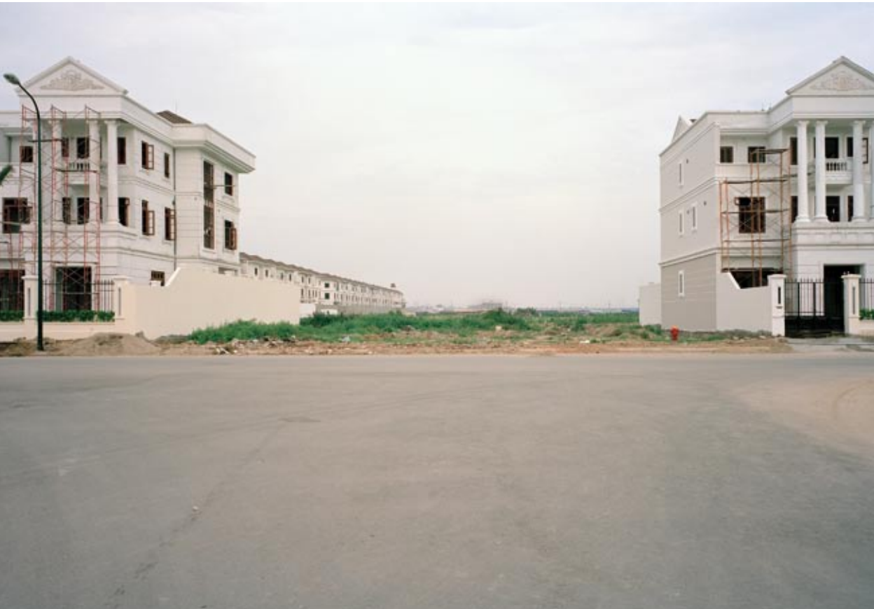
Neubaugebiet Hanoi, 2005 Development area Hanoi, 2005