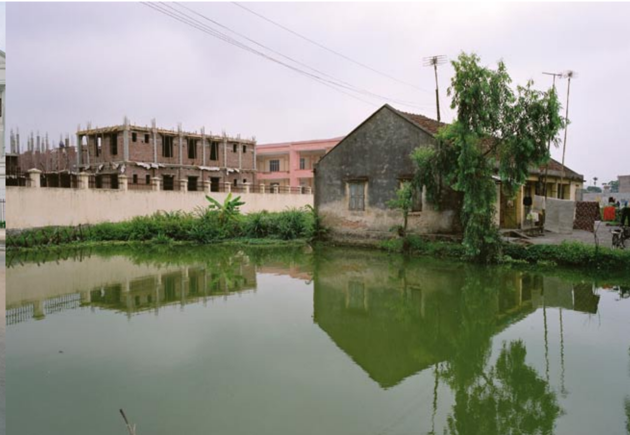
Ländliche Umgebung Hanoi, 2007 Countryside Hanoi, 2007