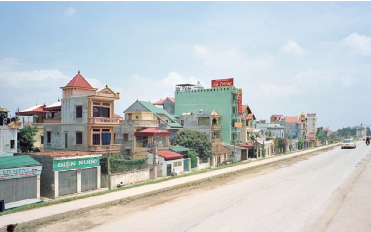
◀ Hanoi Altstadt, 2007 Hanoi old town, 2007