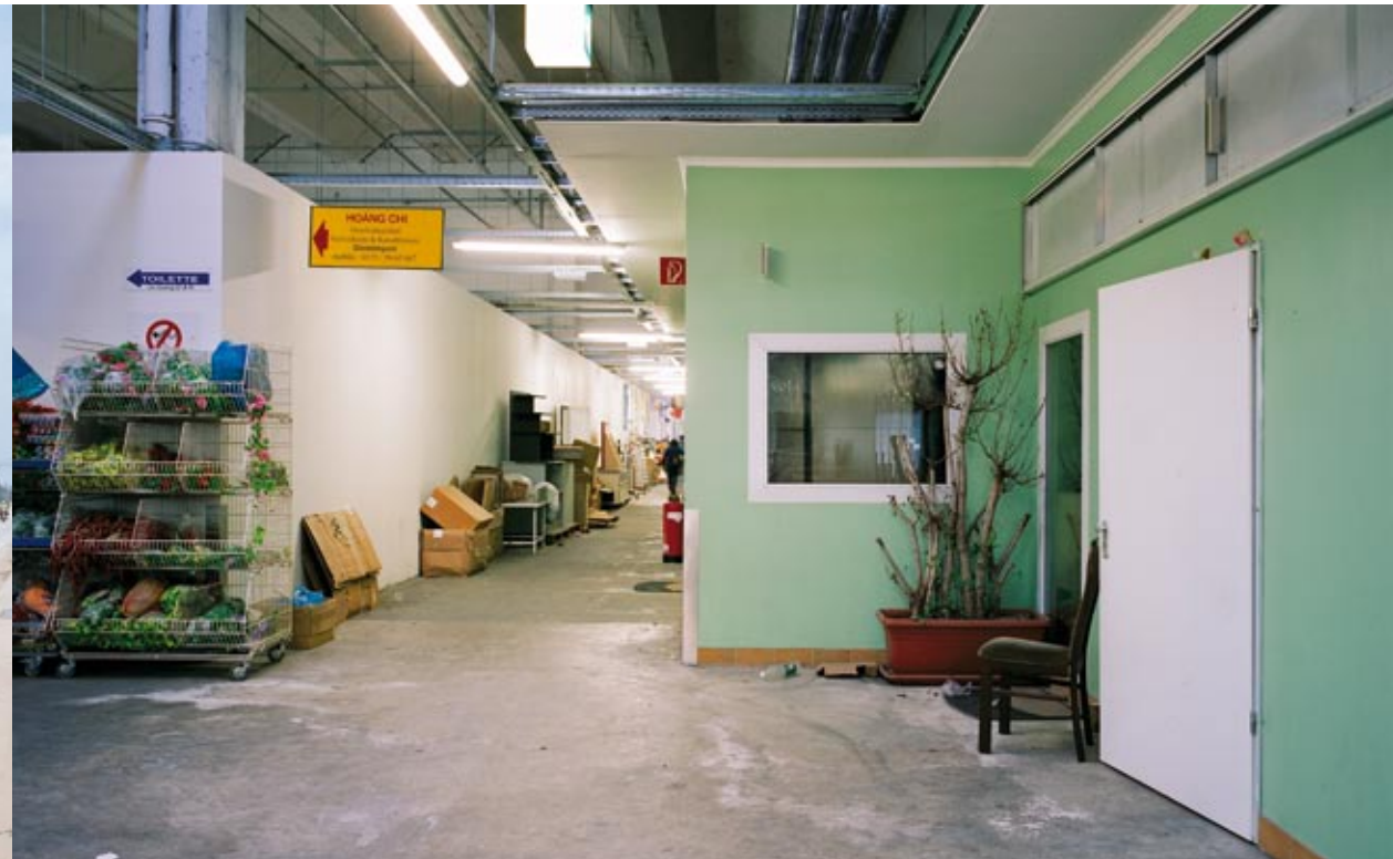
▲ Vietnamesischer Großmarkt Berlin, 2007 Vietnamese wholesale Berlin, 2007